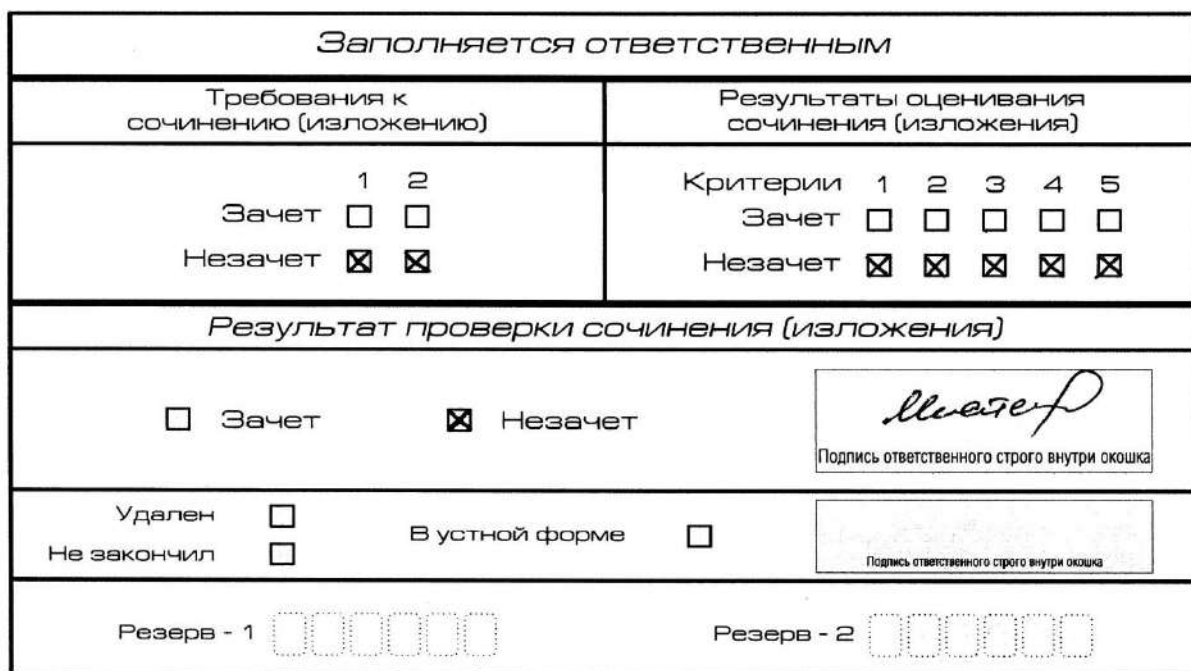
Рис. 8. Область для оценки работы