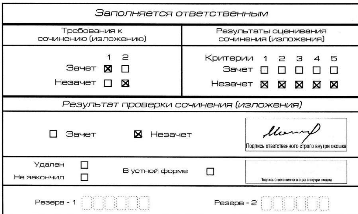
Рис. 9. Область для оценки работы

Если итоговое сочинение (изложение) соответствует требованию № 1 и требованию № 2, то выставляется «зачет» за выполнение требования № 1 и требования № 2. Указанные сочинения (изложения) далее оцениваются по критериям.