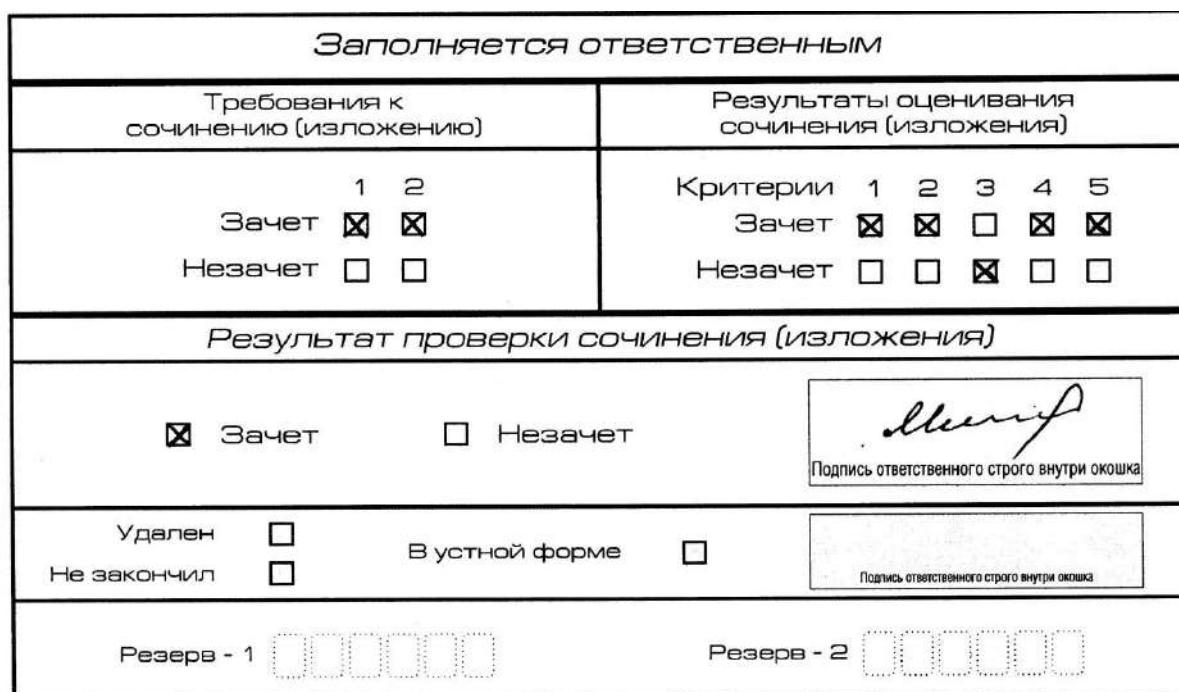
Рис. 10. Область для оценки работы

3. Во всех остальных случаях итоговое сочинение (изложение) проверяется по всем пяти критериям и оценивается по системе «зачет»/«незачет».