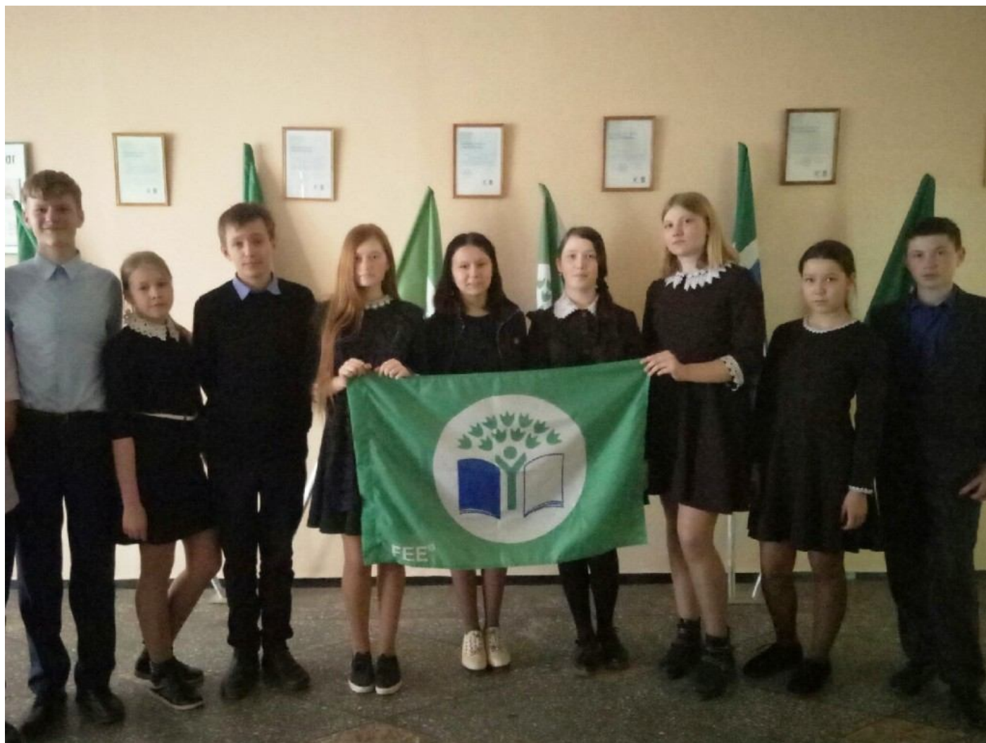
Активисты экологического отряда школы