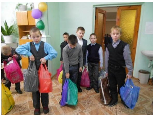
1-4 классы «Берегите планету»