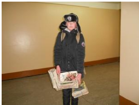
5-6 классы «Наша хрупкая планета»